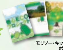
モリゾー・キッコロオリジナルポストカード(3枚)と花の種(1種)