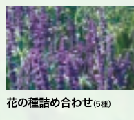
花の種詰め合わせ(5種)